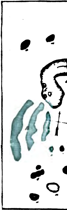
Земляное укрѣпл Нико