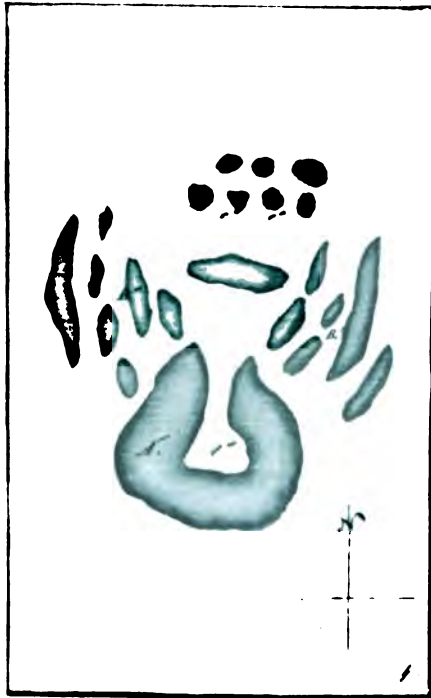
Земляное укрѣплєніє близъ сельца Камчатки.