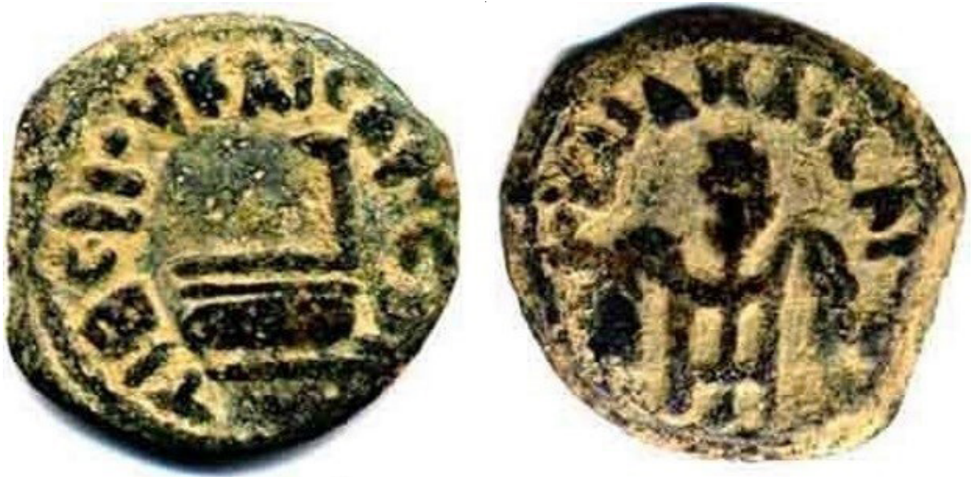
Рис. 3. Монета, чеканенная Понтием Пилатом. Надписи сделаны по-гречески, поскольку Иудея относилась к числу эллинизированных провинций Римской империи. Реверс: греческая надпись ΤΙΒΕΡΙΟΥ ΚΑΙΣΑΡΟΣ (Тиберий Кесарь) и дата LIS (год 16 правления Тиберия = 29/30 г. н.э.). Аверс: греческая надпись ΙΟΥΛΙΑ ΚΑΙΣΑΡΟΣ (Юлия Кесарь – Юлия Августа). Юлия (Ливия) – мать императора Тиберия

за возрождение своей государственности, как на уровне тихого саботажа, так и на уровне открытого протеста, могла развернуться с новой силой, что и обусловило остроту конфликта между иудеями и римской властью. Упоминания об этой борьбе, об охвативших Иудею антиримских выступлениях, можно обнаружить в Евангелиях: «Тогда был в узах некто, по имени Варавва, со своими сообщниками, которые во время мятежа сделали убийство» (Марк. 15.7); «В это время пришли некоторые и рассказали Ему (Иисусу Христу – М.Ж.) о Галилеянах, которых кровь Пилат смешал с жертвами их. Иисус сказал им на это: думаете ли вы, что эти Галилеяне были грешнее всех Галилеян, что так пострадали? Нет, говорю вам, но, если не покаетесь, все так же погибнете» (Лука. 13. 1-3).