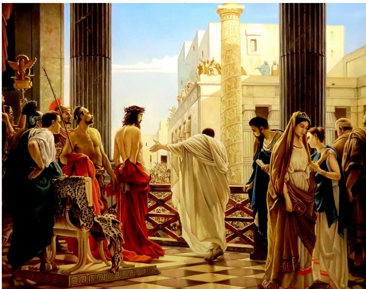
Рис. 7. Антонио Чизери. Ecce Homo (Се, Человек! 1871). Понтий Пилат показывает подвергнутого бичеванию Иисуса жителям Иерусалима, в правом углу изображена скорбящая жена Пилата

ский: «одним из людей Тиберия был Пилат, ставший наместником Иудеи» – Πιλάτος ἦν τῶν υπάρχων ἐπίτροπος ἀποδεειγμένως τῆς Ἰουδαίας οὗτος οὐκ ἐπὶ τιμῇ Τιβεριῶν), и будучи верным и достойным солдатом Рима, в период своего правления Иудеей руководствовался интересами Рима и своей целью во главу угла ставил приведение мятежных евреев к покорности Римскому государству, обеспечение в провинции мира, безопасности и стабильности, недопущение никаких проявлений иудейского сепаратизма.