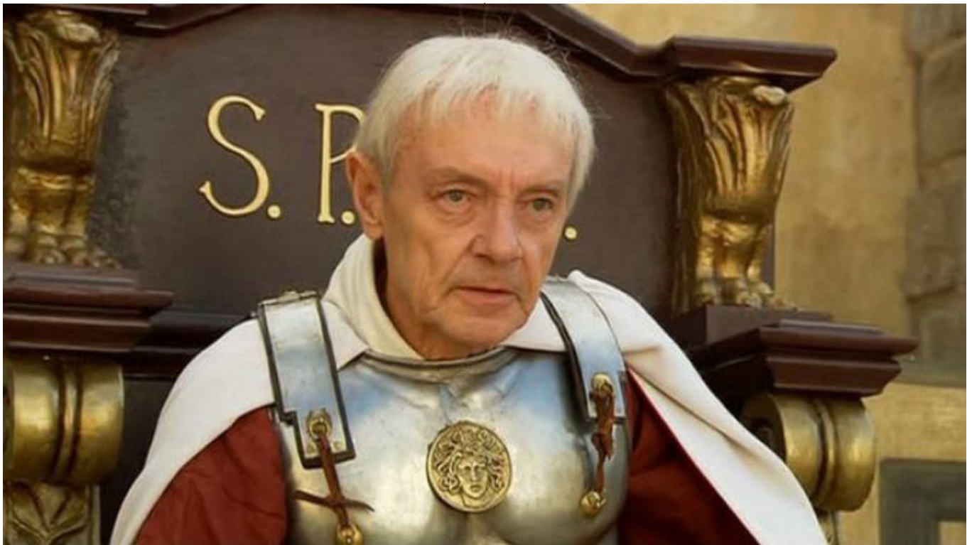
Рис. 10. Кирилл Лавров в роли Понтия Пилата ("Мастер и Маргарита", 2005, реж. Владимир Бортко)

после Его Воскресения: «Посему они, сойдясь, спрашивали Его, говоря: не в сие ли время, Господи, восстановишь Ты царство Израилю?» (Деяния. 1.6).