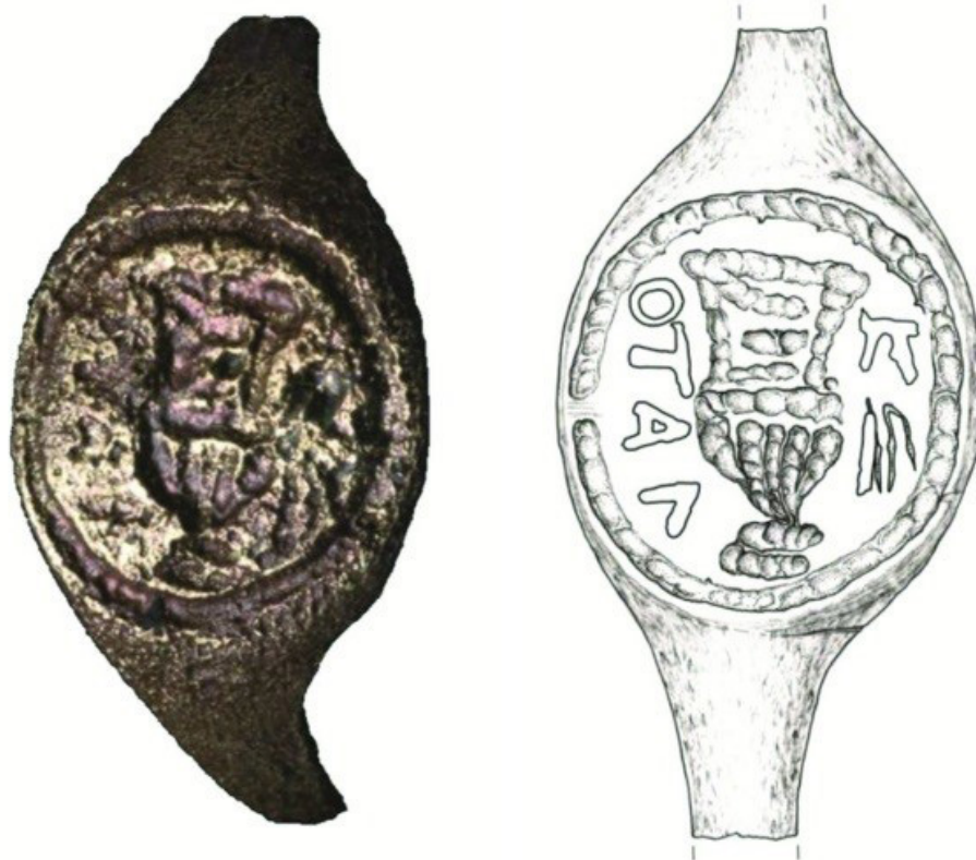
Рис. 6. Кольцо-печать с именем «Пилат»

лиме множество волнений, был подавлен такой тревогой, исходившей от Гая, что, пронзив себя собственной рукой, в скорой смерти искал сокращение мучений» (История против язычников. VII.5.8; Павел Орозий 2009: 434).