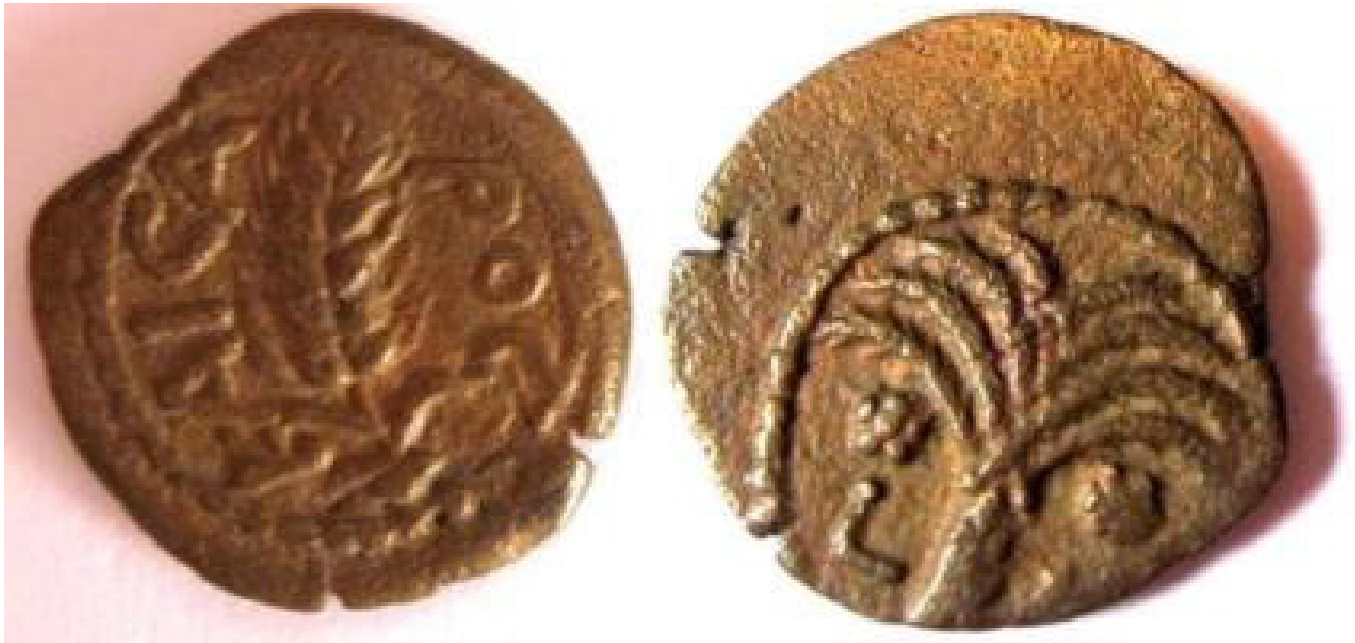
Рис. 4. Монета, отчеканенная в период правления Копония (6 г. до н.э. – 9 г. н.э.) в Иудее

сандрийского также как ἐπίτροπος, но ещё Т. Моммсен пришёл к выводу, что Понтий Пилат должен был иметь более значимую должность префекта (praefectus), т.е. не просто уполномоченного по налоговым сборам в провинции, а военачальника, облеченного военной властью наместника императорской провинции (Mommsen 1887: 236).