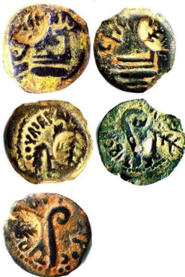
Рис. 5. Монеты Понтия Пилата с более поздним надчеканом, заменяющим римские языческие символы на нейтральное изображение пальмовой ветви

не вооружились, поверив этой басне, и расположились в деревушке Тирафана. Тут к ним примкнули новые пришельцы, чтобы возможно большею толпою подняться на гору. Однако Пилат предупредил это, выслав вперед отряды всадников и пехоты, которые, неожиданно напав на собравшихся в деревушке, часть из них перебили, а часть обратили в бегство. При этом они захватили также многих в плен, Пилат же распорядился казнить влиятельнейших и наиболее выдающихся из этих пленных и беглецов.