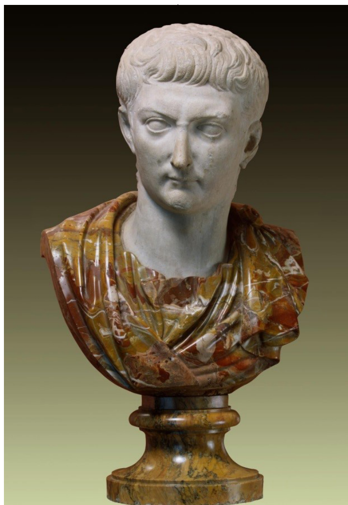
Рис. 1. Портрет императора Тиберия. Древний Рим, первая четверть I в. н.э. Государственный Эрмитаж

ей ещё в битве при Кавдинском ущелье (321 г. до н.э.), а другой, Понтий Телезин, был одним из лидеров италиков во время Союзнической войны (91-88 до н.э.), а затем воевал против Суллы за автономию Самния и погиб в битве у Коллинских ворот (82 г. до н.э.), после чего самниты, италийское племя, долго и упорно боровшееся против римского владычества в Италии, лишилось всех остатков автономии, а род Понтиев, или какая-то его ветвь, видимо, перестаёт быть оппозиционным Риму, став частью римской аристократии.