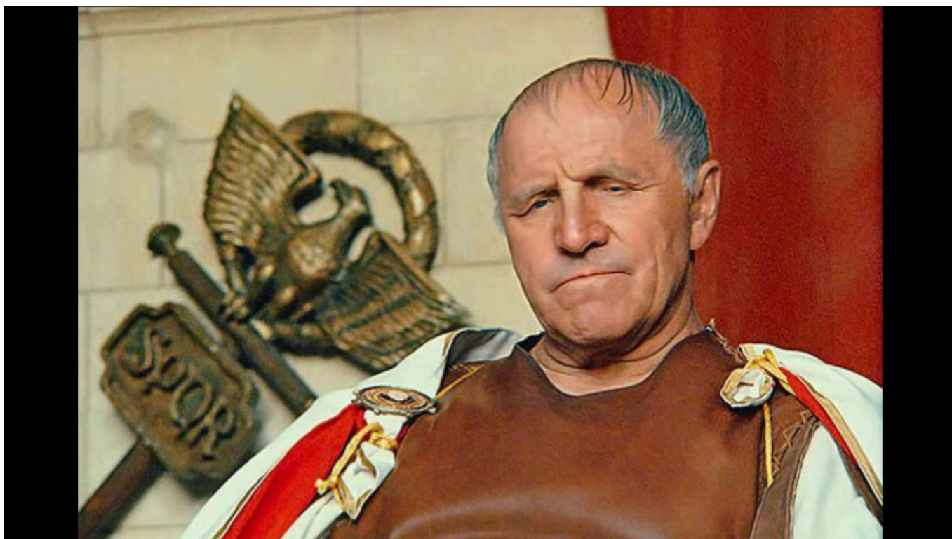
Рис. 9. Михаил Ульянов в роли Понтия Пилата ("Мастер и Маргарита", 1994, реж. Юрий Кара)