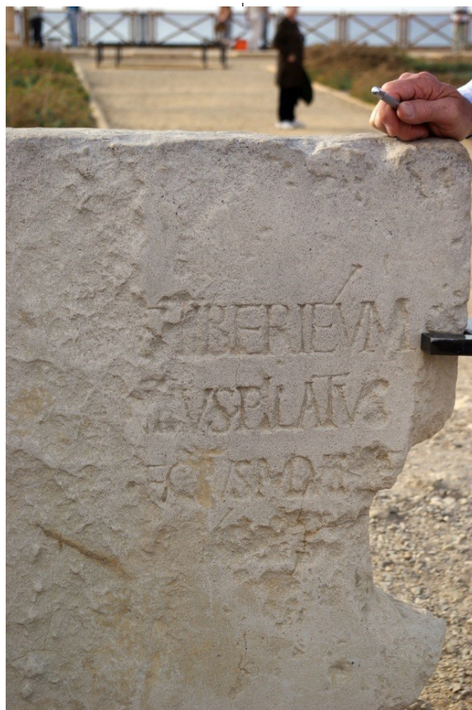
Рис. 2. Плита из Кесарии с посвятительной надписью Понтия Пилата

прочие же установления, мерзкие и гнусные, держатся на нечестии, которое царит у иудеев: самые низкие негодяи, презрев веру отцов, платили им подати, жертвовали деньги и оттого возросло могущество этого народа; возросло оно еще и оттого, что иудеи охотно помогают друг другу, зато ко всем прочим смертным враждебны и ненавидят их. Ни с кем не делят они ни пищу, ни ложе, избегают чужих женщин, хотя преданы разврату до крайности и со своими творят любые непотребства; они и обрезание ввели, чтобы отличать своих от всех прочих. Те, что по своей воле перешли к ним, тоже соблюдают все эти законы, но считаются принятыми в число иудеев лишь после того, как исполнятся презрения к своим богам, отрекутся от родины, отрекутся от родителей, детей и братьев» (История. V; Корнелий Тацит 1993а: 549).