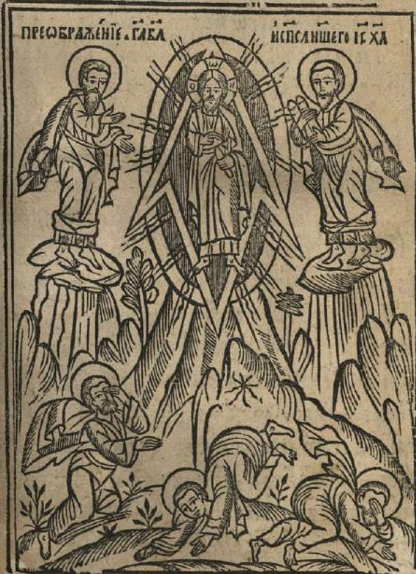
ПРЕВЪБРАЖЕНІЕ ГАБА ИСПСА ИСА ХА

* МА: ЗІ. ІСН. МА: Д. А. ЛД: Д. ІС. МА: ЗІ. А. МА: Д. Б. ЛД: Д. ІСН.