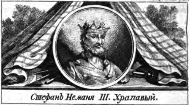
Стефанъ Неманя III. Храпавый.