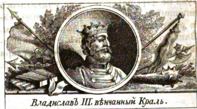
Владиславъ III. вѣнчанный Краль.